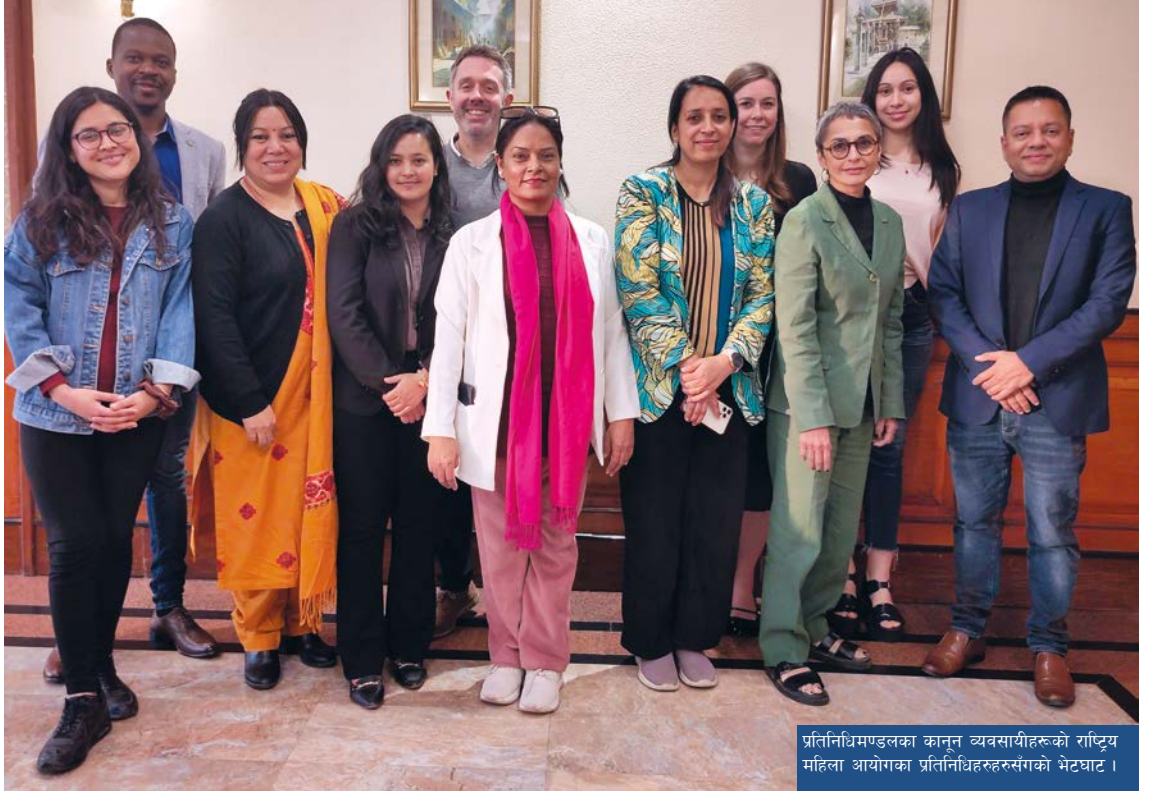
प्रतिनिधिमण्डलका कानून व्यवसायीहरूको राष्ट्रिय महिला आयोगका प्रतिनिधिहरूसँगको भेटघाट ।