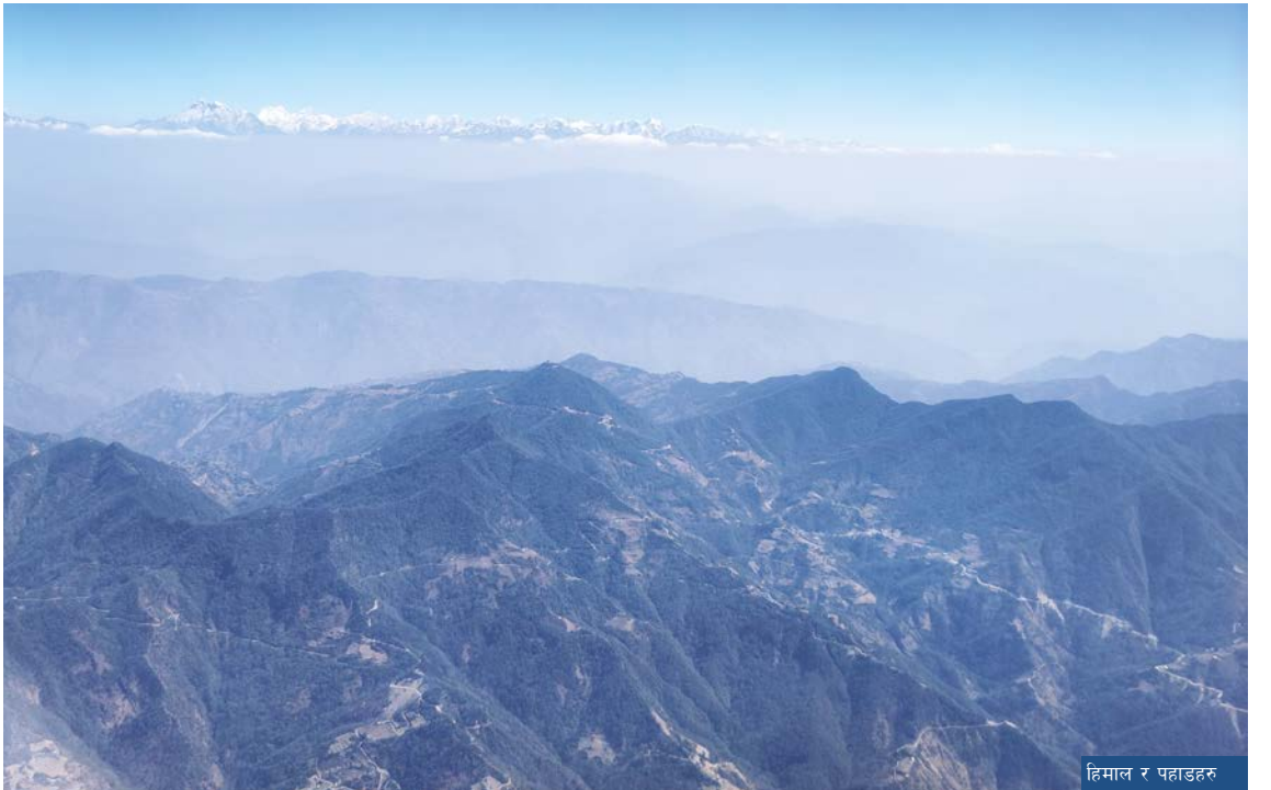
हिमाल र पहाडहरू