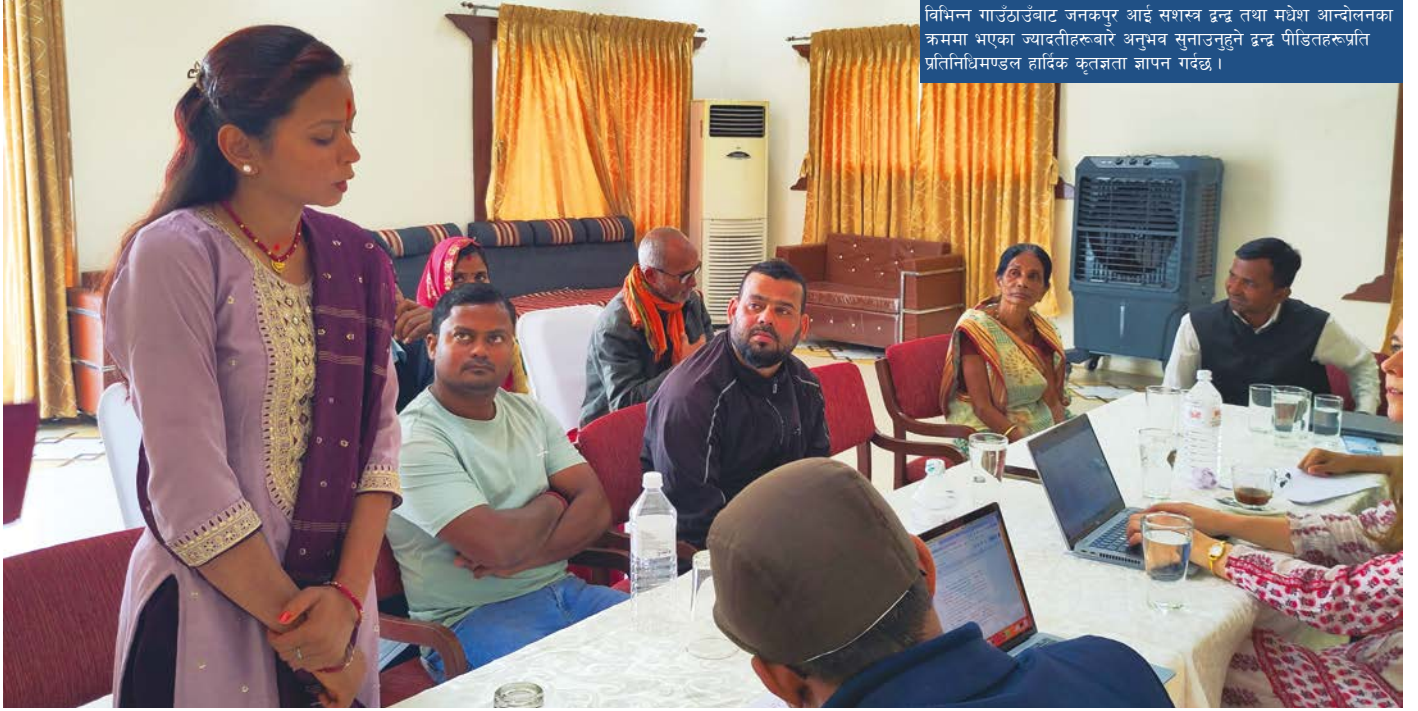
विभिन्न गाउँठाउँबाट जनकपुर आई सशस्त्र द्वन्द्व तथा मधेश आन्दोलनका क्रममा भएका ज्यादतीहरूबारे अनुभव सुनाउनुहुने द्वन्द्व पीडितहरूप्रति प्रतिनिधिमण्डल हार्दिक कृतज्ञता ज्ञापन गर्दछ ।