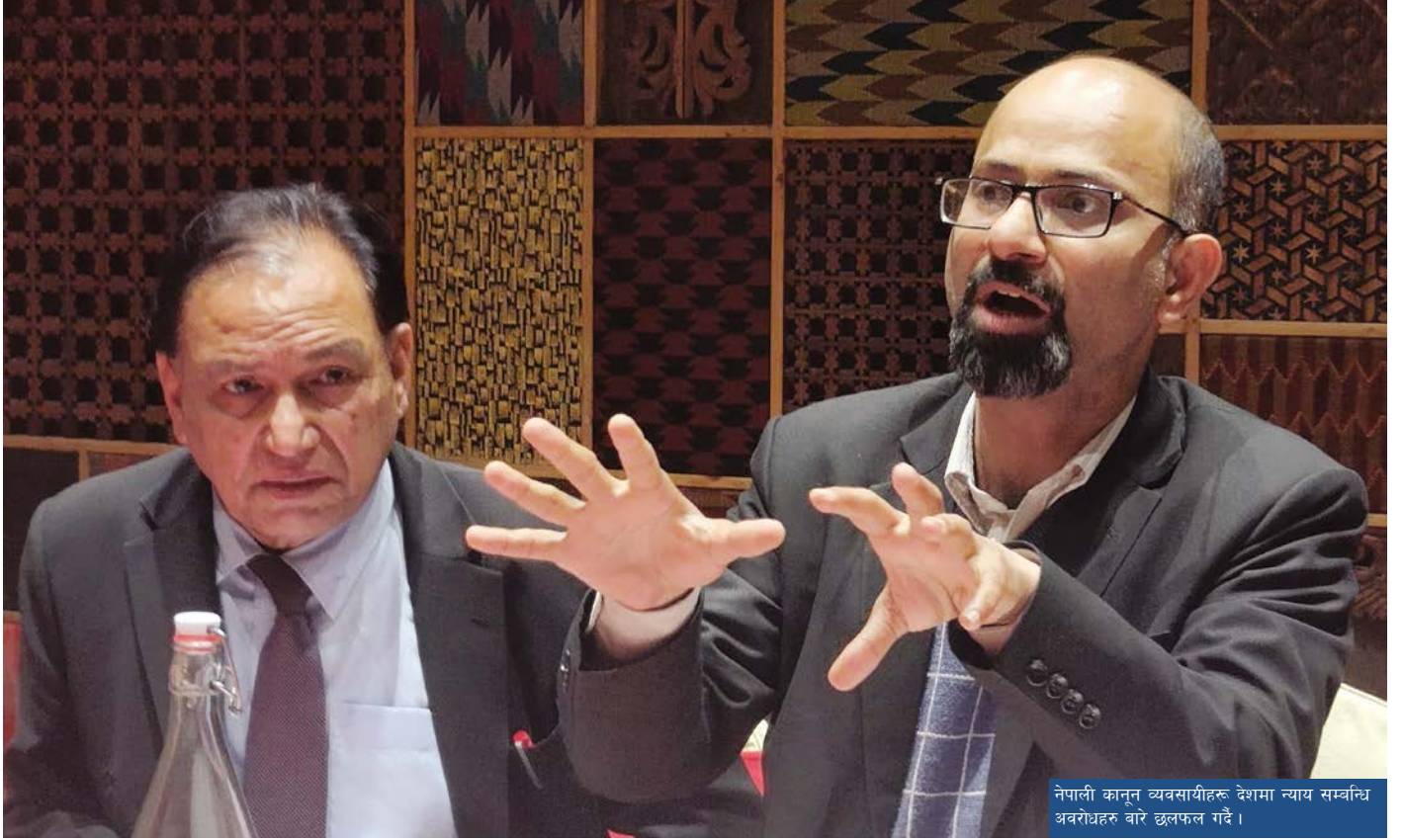
नेपाली कानून व्यवसायीहरू देशमा न्याय सम्बन्धि अवरोधहरू बारे छलफल गर्दै ।

सामाजिक तथा सांस्कृतिक अधिकार सम्बन्धी अन्तर्राष्ट्रिय प्रतिज्ञापत्र, १०६ बाल अधिकार सम्बन्धी महासन्धि, १०७ बाल अधिकार सम्बन्धी महासन्धि र सशस्त्र द्वन्द्वमा बालबालिकाको संलग्नता विरुद्धको महासन्धिका ऐच्छिक आलेखहरू, १०८ बाल श्रम निषेध, कारवाही तथा उन्मूलन सम्बन्धी अन्तर्राष्ट्रिय श्रम संगठनको महासन्धि, १०९ महिलाविरुद्ध सबै प्रकारका भेदभाव उन्मूलन गर्ने महासन्धि, ११० सबै प्रकारका जातीय भेदभाव उन्मूलन सम्बन्धी अन्तर्राष्ट्रिय महासन्धि, १११ र अपाङ्गता भएका व्यक्तिहरूको अधिकार सम्बन्धी महासन्धि। ११२ यसका अतिरिक्त नेपालले २००५ मंसिर २५ (सन् १९४८ डिसेम्बर १०) मा संयुक्त राष्ट्रसंघको महासभाले अनुमोदन गरेको मानवअधिकारको विश्वव्यापी घोषणापत्रमा उल्लेख गरिएका अधिकारहरूको रक्षा र सम्मान गर्ने दायित्व पनि रहेको छ। ११३