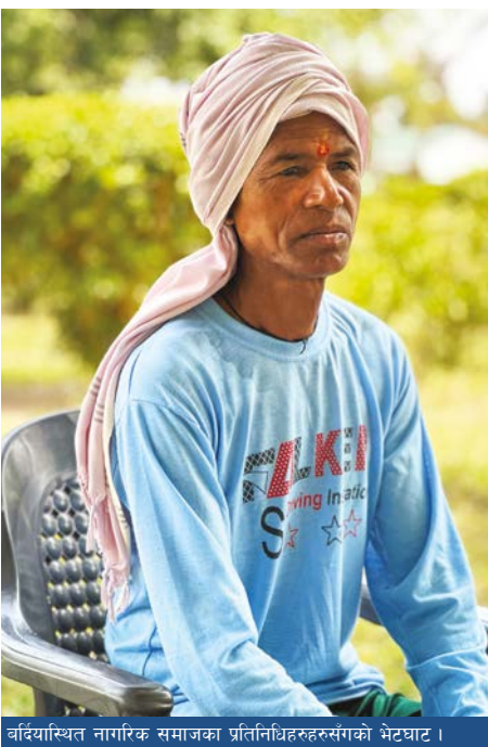
वर्दियास्थित नागरिक समाजका प्रतिनिधिहरूसँगको भेटघाट।