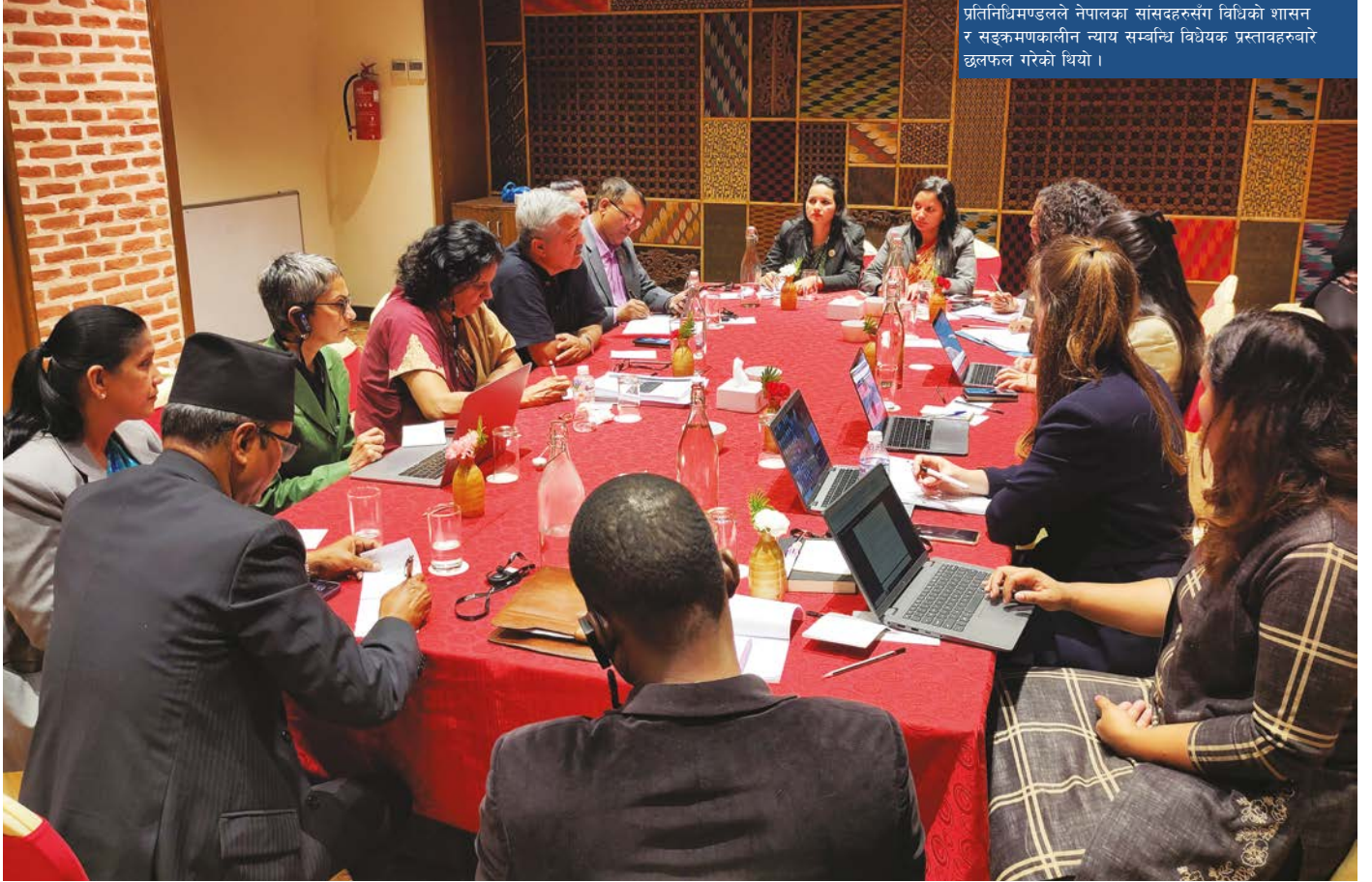
प्रतिनिधिमण्डलले नेपालका सांसदहरूसँग विधिको शासन र संक्रमणकालीन न्याय सम्बन्धि विधेयक प्रस्तावहरूबारे छलफल गरेको थियो ।