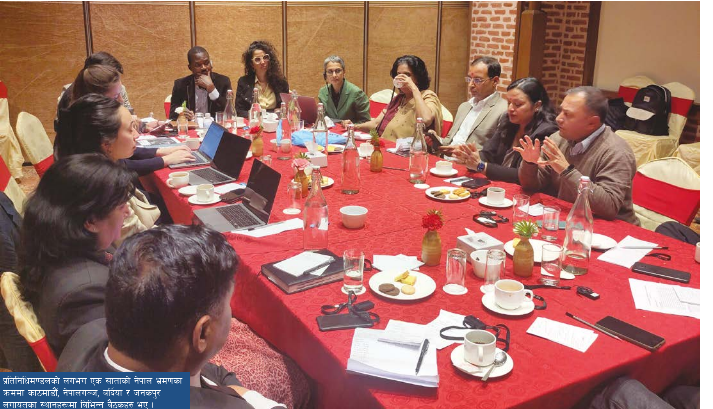
प्रतिनिधिमण्डलको लगभग एक साताको नेपाल भ्रमणका क्रममा काठमाडौं, नेपालगञ्ज, बर्दिया र जनकपुर लगायतका स्थानहरूमा विभिन्न बैठकहरू भए।

नेपालमा संक्रमणकालीन न्यायको खोजीमा सक्रिय पीडित समूहहरू, सामुदायिक संस्थाहरू, राष्ट्रिय वार एशोसिएशन, राष्ट्रिय र अन्तर्राष्ट्रिय गैरसरकारी संस्थाहरू लगायत ऊर्जाशील नागरिक समाजको बलियो उपस्थिति रहेको छ। यी मानवअधिकार रक्षकहरूले पीडितहरूलाई आफ्ना अनुभवहरू खुलासा, दस्तावेजीकरण र अभिलेख संकलनमा सहायता गर्न, मानवअधिकारको उल्लङ्घनको लागि न्यायको माग गर्न र सङ्क्रमणकालीन न्याय प्रक्रियासम्बन्धी सार्वजनिक परामर्शहरूमा सक्रिय भई आफ्ना मागहरू मुखरित गर्ने सन्दर्भमा मनोसामाजिक, कानूनी, पैरवी तथा अन्य व्यावहारिक सहायता प्रदान गर्दै आइरहेका छन्। राष्ट्रिय सञ्चारमाध्यमले जनचेतना प्रवर्धनका लागि अहम् भूमिका खेल्दै आएको छ। संयुक्त राष्ट्रसंघीय मानव अधिकार परिषदमा हालसालै दिएको एक