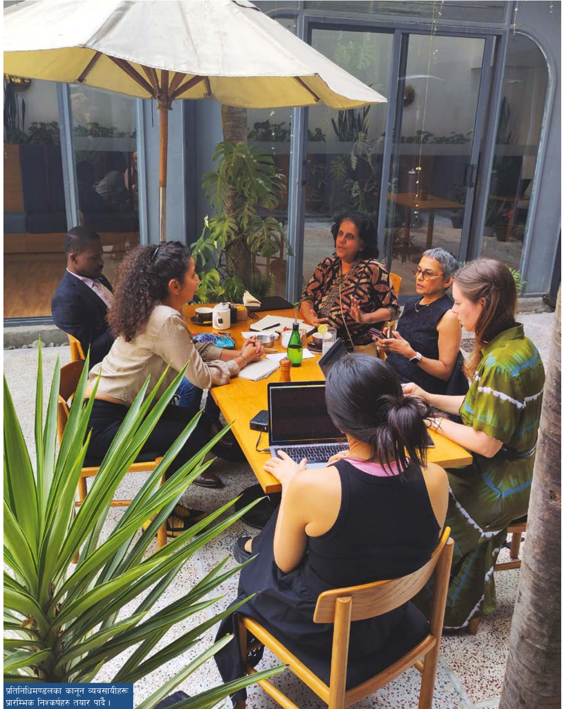
प्रतिनिधिमण्डलका कानून व्यवसायीहरू प्रारम्भिक निष्कर्षहरू तयार पाउँदै ।

निष्कर्ष: ऐनको संशोधन गर्नेतर्फ राज्यको प्रयत्नप्रति प्रतिनिधिमण्डल लगभग आशावादी भएतापनि पारित विधेयकबारे सरोकारवालाहरू र प्रतिनिधिमण्डलका साभा चासो र चिन्ताका विषयहरू छन् । यसका कारणहरू तल उल्लेख गरिएका छन् ।