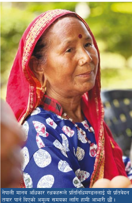
नेपाली मानव अधिकार रक्षकहरूले प्रतिनिधिमण्डललाई यो प्रतिवेदन तयार पार्न दिएको अमूल्य समयका लागि हामी आभारी छौं ।