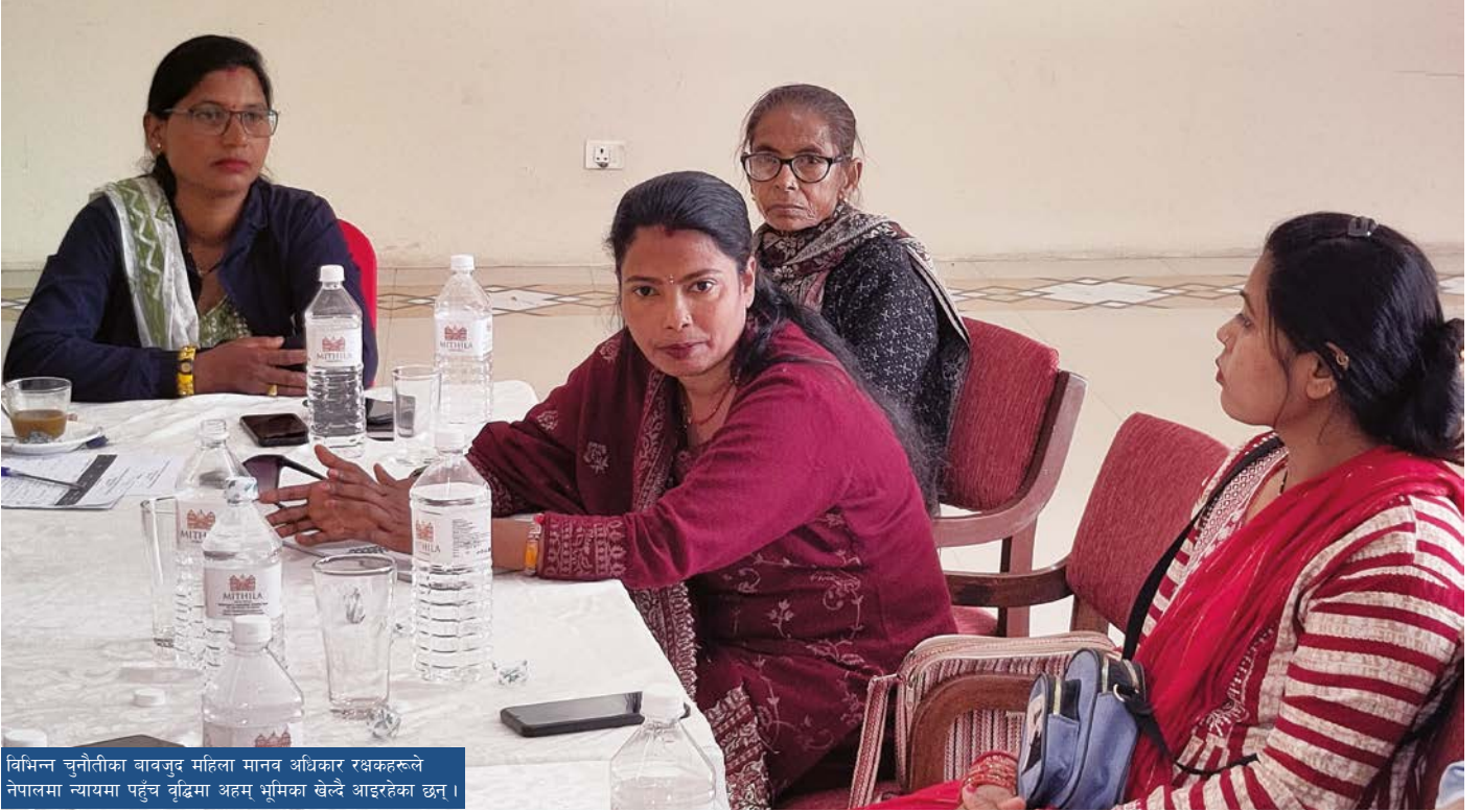
विभिन्न चुनौतीका बावजूद महिला मानव अधिकार रक्षकहरूले नेपालमा न्यायमा पहुँच बढिमा अहम् भूमिका खेल्दै आइरहेका छन् ।